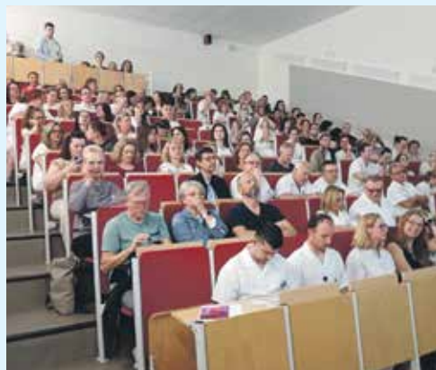
O SEMINÁŘ projevil zdravotníci kladenské nemocnice mimořádný zájem.

pokládáme za důležité. V naší nemocnici je tradicí. Podobné akce pořádají také kolegové z dalších oddělení. Naše ARO tak například kromě tohoto tématu pořádá ještě pro sestřičky seminář o problematice žilních vstupů nebo nyní v aktuální době seminář o paliativní péči a jejím optimálním nastavení v rámci nemocničního provozu. Letos na podzim ještě plánujeme seminář o analgetické terapii,“ přiblížil detaily pan primář Lukáš Rokos.