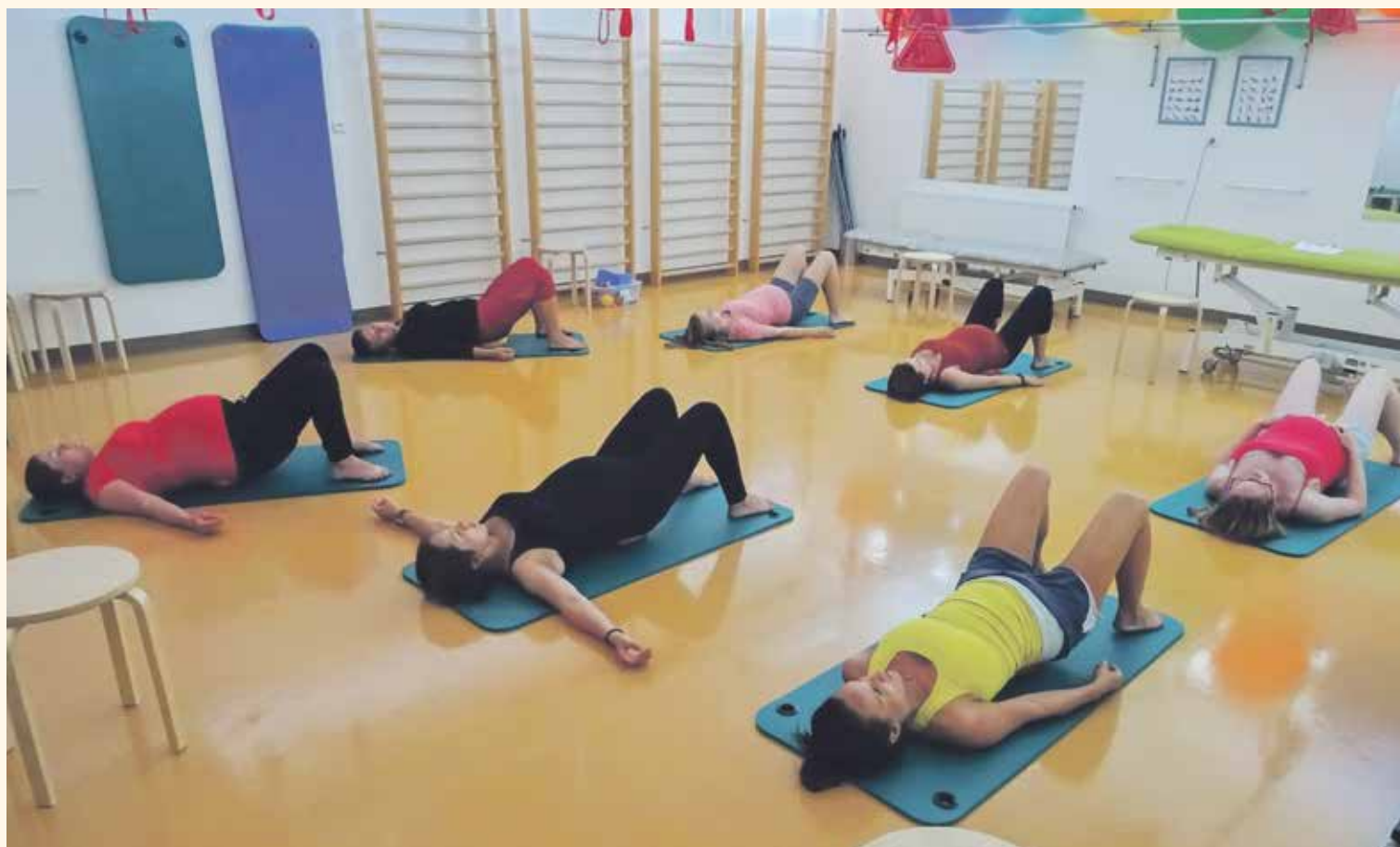
OBLÍBENOU AKTIVITOU mezi budoucími maminkami bývají lekce cvičení pro těhotné. I to naše nemocnice nabízí.

nekologa je nanejvýš vhodné, neboť součástí této péče je mimo jiného také minimálně jednou ročně pravidelná gynekologická prohlídka. Ta může hrát významnou roli při předcházení případných zdravotních problémů. Pro objednání a registraci můžete volat na telefonní číslo 312 606 451 v pracovních dnech v době od 7:00 do 15:00 hodin.