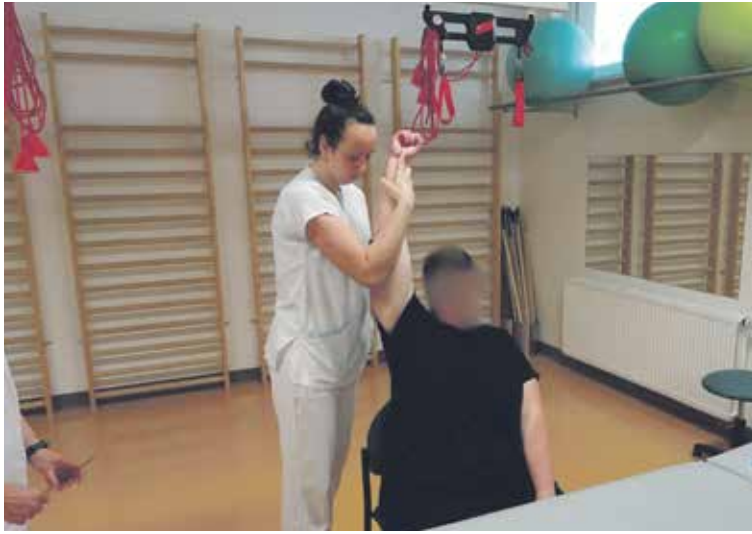
BĚHEM VYŠETŘENÍ spolupracují lékař, fyzioterapeut a ergoterapeut.