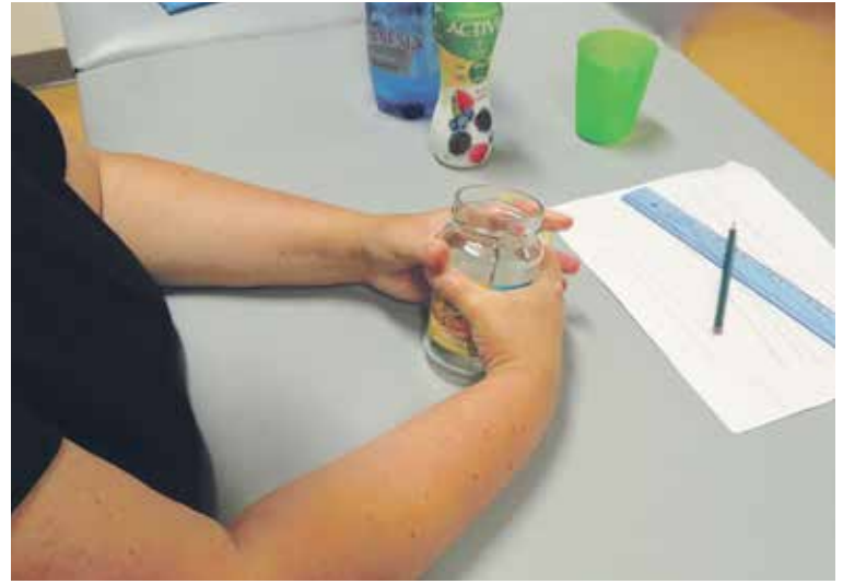
FUNKČNÍ VYŠETŘENÍ RUKY je nedílnou součástí komplexního přístupu.

ných postižení mozku, například po úrazech či operacích mozku, je protahování a posilování zkrácených a oslabených svalů a aplikace botulotoxinu do hyperaktivních spastických svalů. U spastické parézy jsou hyperaktivní svaly téměř všechny – podle podrobného vyšetření pacienta ve spastické ambulanci vybíráme ty svaly, které svým hypertónem brání cílenému pohybu, a do těchto konkrétně vybraných svalů je aplikován botulotoxin za účelem tyto svaly oslabit. Intramuskulární