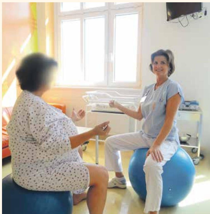
PORODNÍ ASISTENTKY během porodu využívají moderní trendy.

Gynekologicko-porodnické oddělení kladenské nemocnice nabízí budoucím maminkám ještě další výhodu: pokud nemají svého gynekologa, mohou se registrovat do všeobecné