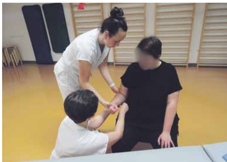
VYŠETŘENÍ PACIENTŮ ve spastické ambulanci je velmi detailní.

» Paní doktorko, v čem zhoršená hybnost končetin lidí po CMP spočívá? Jde o komplexní problém. Ve svalectech se projevuje třemi příznaky, těmi jsou paréza (oslabení) svalů, zvýšená aktivity svalů a zkrácení svalů. Tyto pří-