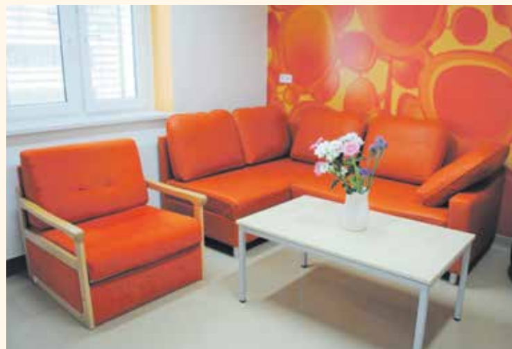
MAMINKY MAJÍ v kladenské porodnici moderní pokoje s veškerým potřebným vybavením na žádané úrovni.