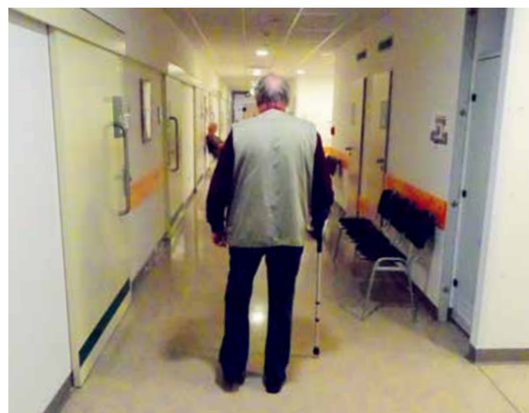
V TERAPII SEHRÁVÁ největší úlohu sám pacient.

Vyžaduje to od něj velké úsilí. To je totiž pro dosažení léčebného cíle skutečně rozhodující a nezastupitelné.