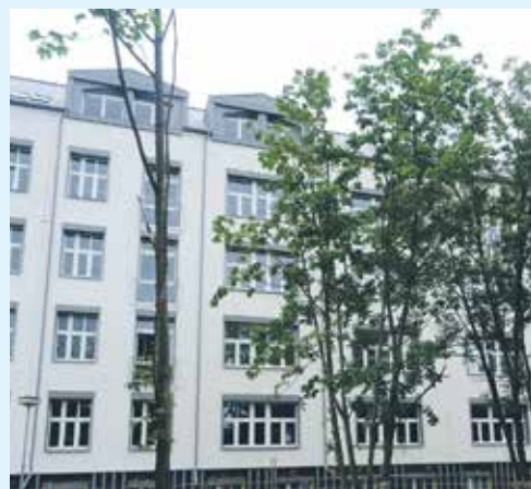
POHLED NA TÉMĚŘ hotovou rekonstrukci pavilonu C2.

Rekonstrukce bloku C2 Oblastní nemocnice Kladno míří do finále. Na druhou polovinu června je plánována kolaudace zrekonstruovaných prostor. Poté nastane fáze, kdy nemocnice postupně obno-