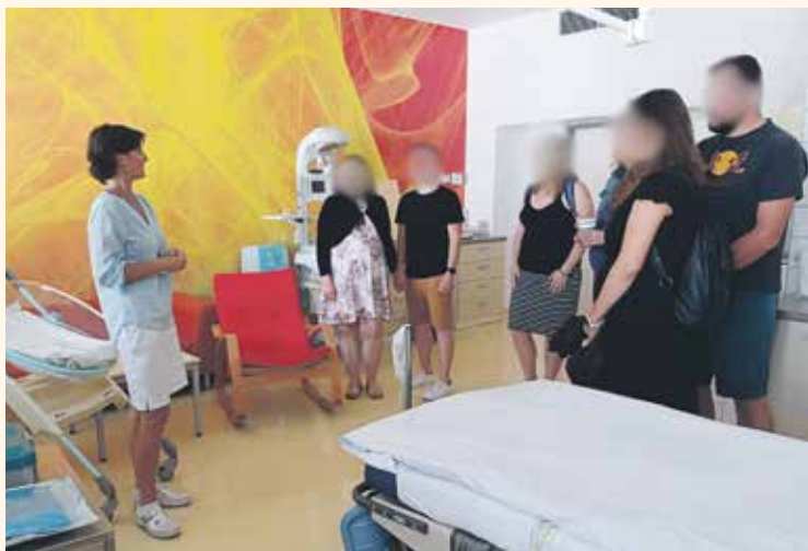
KLADENSKÁ PORODNICE pořádá pravidelné předporodní kurzy spojené i s prohlídkou možností nadstandardního ubytování.

Zúčastnit se je jednoduché: stačí se dostavit před posluchárnu kladenské nemocnice v srpnu ve čtvrtek 1. 8. nebo v září ve čtvrtek 5. 9. 2024 ve 13:30 hodin. V tyto termíny začínají další třídílné bloky kurzů. Předtím než přijdete před posluchárnu, kterou najdete v průjezdu pavilonu C1, se zastavte ve 13:00 hodin v pokladně kladenské nemocnice. Zde zaplatíte poplatek za kurz ve výši 900 korun a dostanete potvrzení o úhradě. Pokladnu najdete v Niederleho pavilonu (budově E), kousek od hlavního vjezdu do nemocnice z ulice Vančurova. Těšíme se na vás.