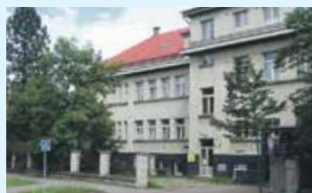
OBLÍBENÝM MÍSTEM filmařů je budova bývalého plicního oddělení v ulici Františka Kloze.

ON Kladno nabízí produkcím pro natáčení zásadně pouze v dané chvíli volné prostory anebo takové prostory, jejichž časově striktně omezené využití žádným způsobem nenarušuje hlavní činnost nemocnice: poskytování zdravotní péče pacientům. Jde například o budovu bývalého plicního oddělení v ulici Františka Kloze. Pro filmování je vhodné celé levé křídlo budovy včetně horního patra. Současný provoz této budovy umožňuje štábům provádět i určité dispoziční úpravy. V nových prostorách nemocnice, například bývalé koronární JIP ve druhém patře budovy CAM, vstupním vestibulu či vstupním prostoru před urgentním příjmem nejsou dispoziční úpravy přípustné. Štáby mají k dispozici jen boxy a sesternu. Navíc nové prostory nemocnice nabízí filmařům k využití ve velmi omezené míře, převážně o víkendech. Štábům se zde líbí