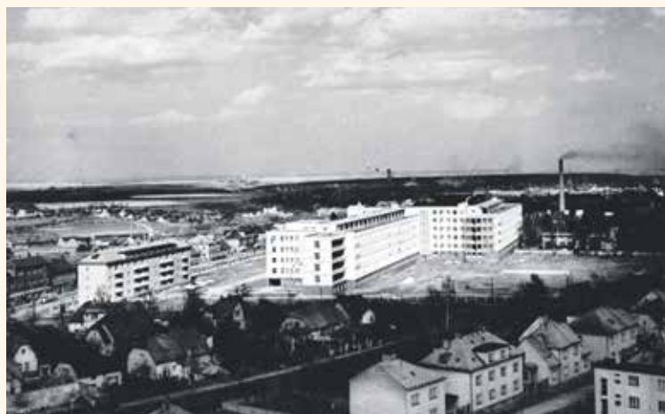
VÝSTAVBA KLADENSKÉ NEMOCNICE v roce 1957.

» Pracoval například jako výhybkář nebo výpravčí. Jeho cesta za studiem na vysoké škole byla znemožněna uzavřením českých vysokých škol, a proto si na své studium musel počkat až do osvobození v roce 1945. «