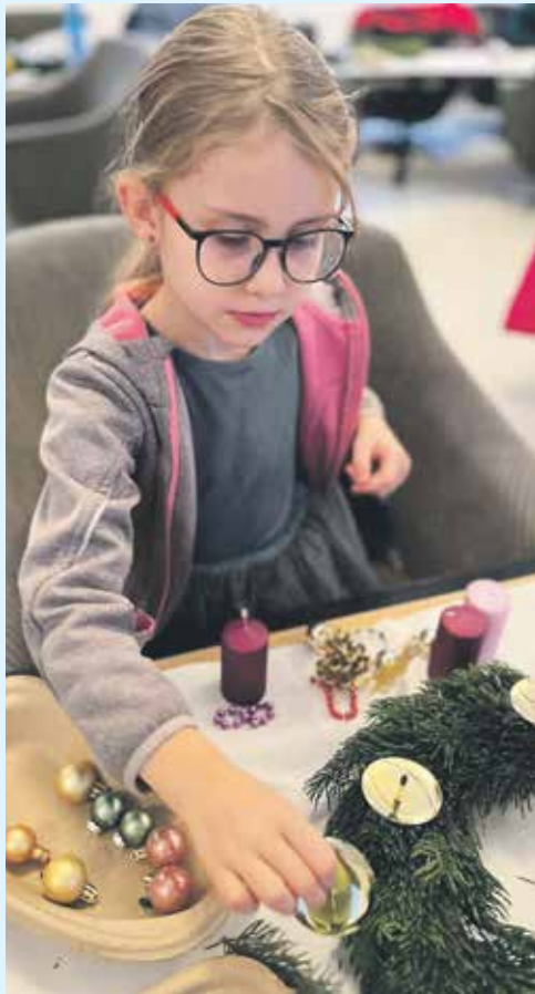
SVÉ VÁNOČNÍ VÝTVORY si mohli vyrobit i malí výtvarníci.