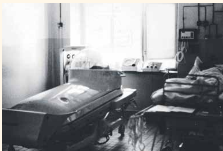
TAKTO VYPADALO KLADENSKÉ resuscitační oddělení v roce 1974.