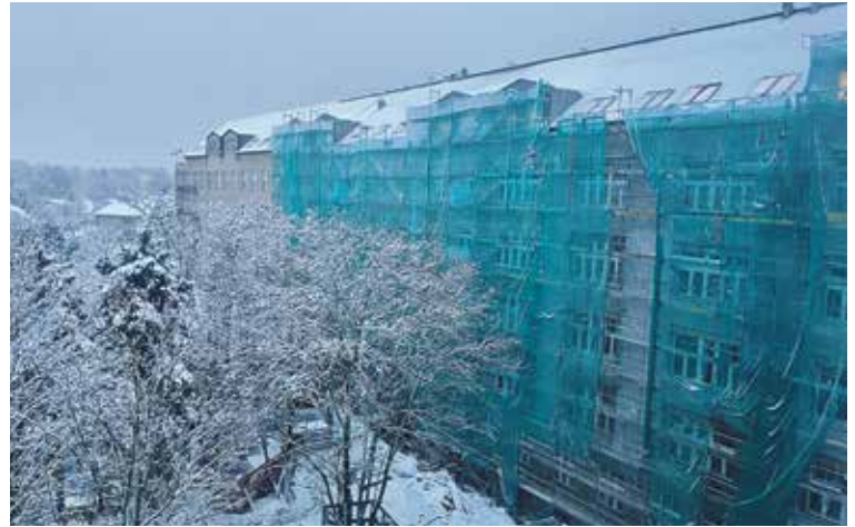
ZVENKU SE ZATEPLUJE OBVODOVÝ PLÁŠŤ , vyměňují se okna a pokládá se nová střešní krytina.

Samozřejmě práce probíhají také na obvodovém plášti, který se zatepluje, a vyměňují se také střešní krytina a střešní okna. (red)