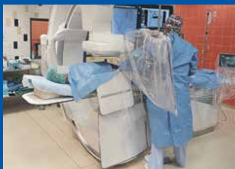
NOVÁ ANGIOLINKA pomáhá pacientům s cévními onemocněními. Strana 3