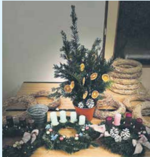
VELMI PĚKNÉ VÁNOČNÍ dekorace vznikly na letošním zdobení adventních věnců.

Vznikla skutečně spousta originálních i tradičních, v každém případě však krásných adventních věnců a dalších vánočních a zimních dekorací. (red)