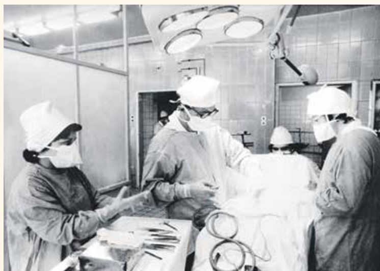
OPERAČNÍ SÁL CHIRURGIE , rok 1981.