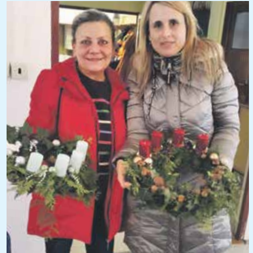
KRÁSNÉ ADVENTNÍ VĚNCE , jejichž autorkami jsou naše kolegyně z oddělení ORL.