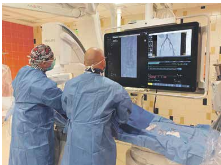
PŘÍSTROJ LÉPE A PŘESNĚJI ZOBRAZUJE , umožňuje integraci snímků z CT, magnetické rezonance i 3D obraz.

Nový model Philips Azurion ClarityIQ, který nahradil starší typ Allura Xper, má několik nesporných výhod. „Díky vyspělejšímu softwaru a hardwaru snižuje o čtvrtinu dávku radiačního záření, což je šetrnější jak pro pacienta, tak pro