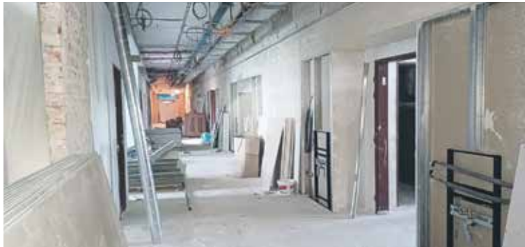
3. PATRO JIŽ MÁ BETONOVÉ PODLAHY a nyní se zde provádějí nosné konstrukce pro sádkokartonové podhledy. Vzniká zde nové lůžkové oddělení urologie s kapacitou 29 lůžek.