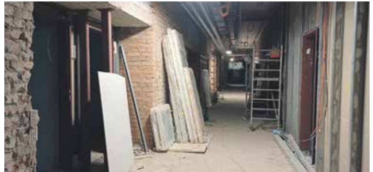
V PŘÍZEMÍ SE BUDE NACHÁZET GYNCENTRUM a urogynnekologická ambulance, ambulance ortopedie a přestěhují se sem také ambulance urologie se třemi vyšetřovny a zákrokovým sálkem.