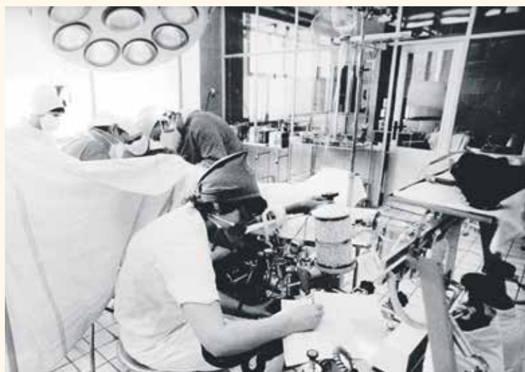
ANESTEZIOLOG PŘI PRÁCI na operačním sále chirurgie v roce 1981.