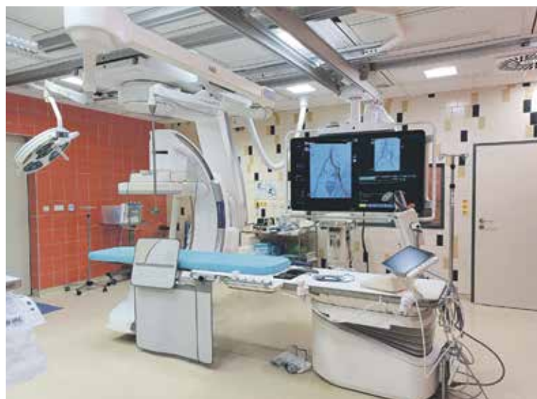
NOVÝ MODEL PHILIPS AZURION CLARITYIQ nahradil starší typ Allura Xper.

Oblastní nemocnice v Kladně pořídila z evropského dotačního programu REACT novou angiolinku za 27 milionů korun. Tento přístroj, který je v současné době jeden z nejmodernějších na trhu, používají na svém cévním sále intervenční radiologové již několik týdnů.