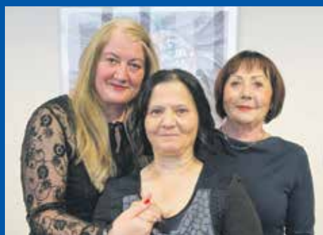
K VÝROČÍ 120 LET otevřela kladenská nemocnice novou galerii. Strana 6