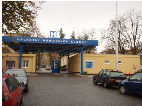
Vjezd do areálu