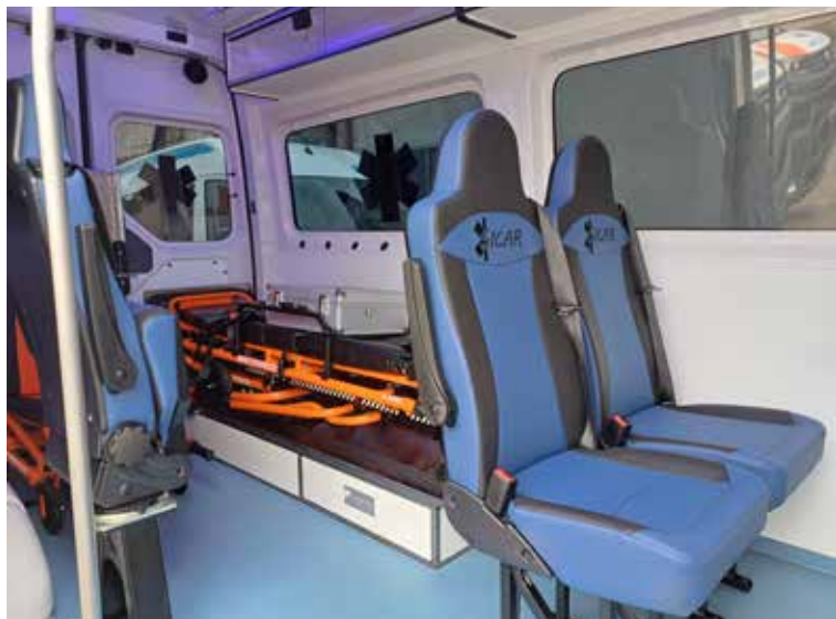
SANITY JSOU PROSTORNĚJŠÍ , mají široký a vysoký vstup a široké rampy.

Dopravní zdravotnická služba Oblastní nemocnice Kladno svými vozy zajišťuje dopravu raněných, nemocných, ale i převoz biologického materiálu. (red)