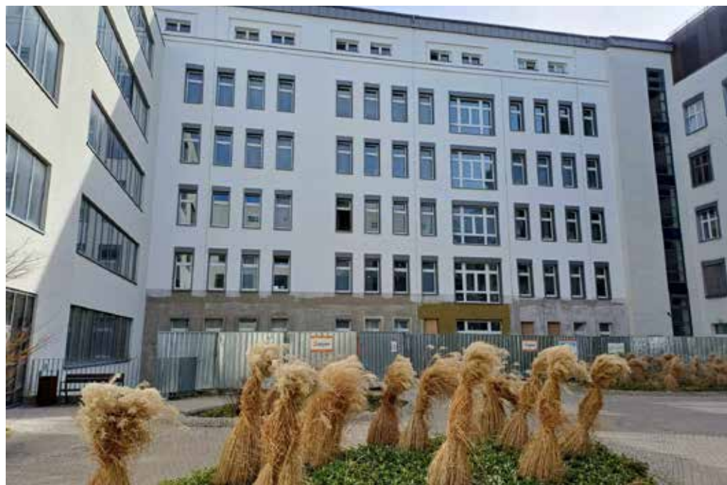
FASÁDA NA SEVERNÍ STRANĚ bloku C2 je již hotová.

Dále probíhají stavební úpravy v suterénu a přízemí – zděné a SDK příčky, hrubé instalace, sádko-kartonové podhledy, finalizuje se fasáda z jižní strany. Hotovo by mělo být na konci června tohoto roku. (red)