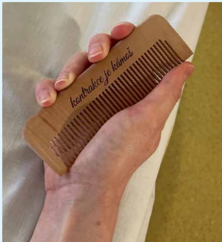
HŘEBÍNEK STIMULUJE AKUPRESURNÍ BODY v dlani a dokáže zmírnit bolest při kontrakci.