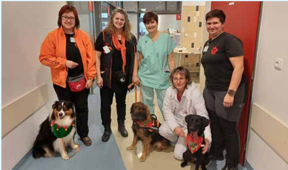
PSÍ SLEČNY RITA, CHILLI A CATTI zpříjemnily nemocniční pobyt pacientům na interním oddělení a potěšily ve službě také naše zaměstnance.

Canisterapie je v léčebném procesu vždy přínosná a přináší pacientům uvolnění, radost a rozptýlení v mnohdy dlouhém pobytu v nemocnici. (red)