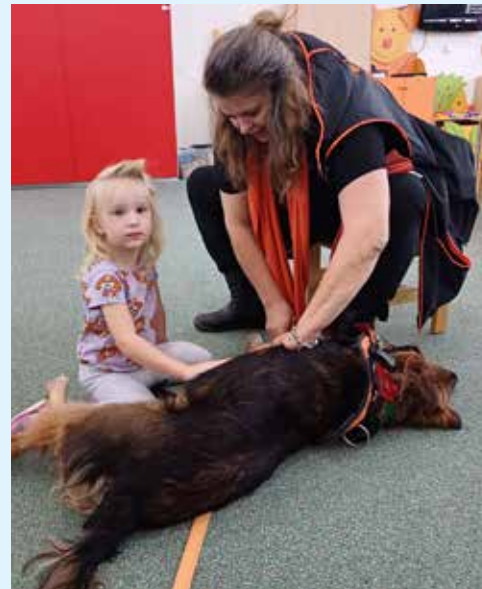
PEJSCI NAVŠTÍVILI také dětskou skupinu, kde předvedli své dovednosti.