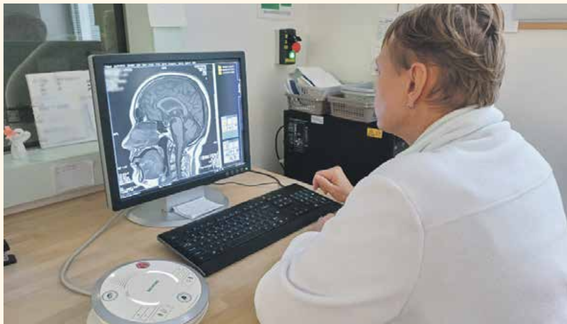
SNÍMEK MOZKOVÝCH STRUKTUR pořízený magnetickou rezonancí.

Zobrazování pomocí magnetické rezonance je založeno na principu odečtu změn magnetických momentů souborů jader prvků s lichým protonovým číslem uložených v silném magnetickém poli po aplikaci radiofrekvenčních pulsů. Diagnostika pomocí magnetické rezonance je založena na tom, že tělo obsahuje v hojném počtu atom vodíku H, který má v jádru pouze jeden proton. Vychází