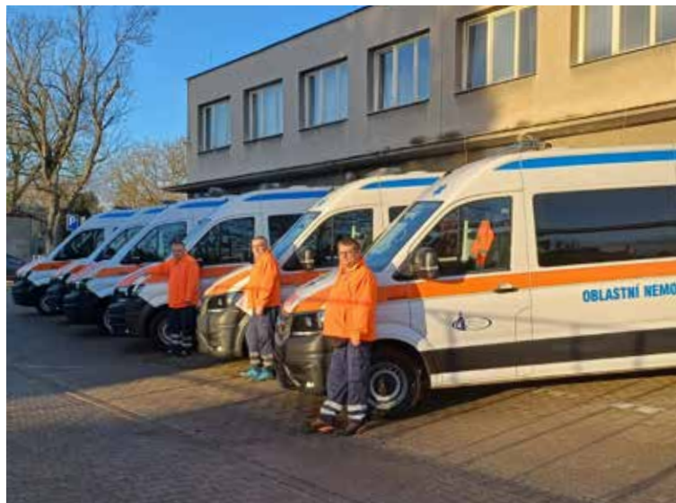
ŠEST NOVÝCH SANITNÍCH VOZŮ již slouží pacientům.