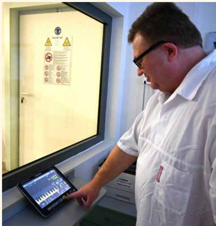
MONITOR, KTERÝ JE BEZDRÁTOVĚ SPOJEN SE ZÁKLADNOU, může anesteziolog ovládat a kontrolovat tak životní funkce pacienta, aniž by k němu vstupoval.

se tedy z měření magnetických momentů jader atomů vodíku obsažených ve vodě (a některých tucích). Informaci o jiných tkáních lze získat nepřímo, protože jinak se chovají protony molekuly vody v sousedství velkých molekul bílkovin a jinak jsou-li obsaženy jen ve vodě (tekutině). Takto zjednodušeně lze popsat základní princip získání MR obrazů.