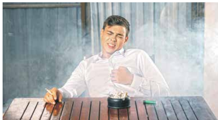
PŘEDPOKLADEM pro udržení zdravých plic je nekouřit.

Nepřestávejte se hýbat, nekuřte a pravidelně chodte na preventivní prohlídky. A pokud se objeví dlouhodobý kašel, dušnost nebo bolest na hrudi, hubnutí, neváhejte se nechat vyšetřit. Včasná diagnostika je vždy největší výhra.