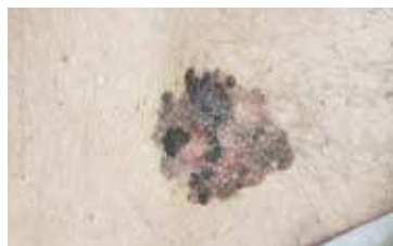
MELANOM KŮŽE MŮŽE MÍT RŮZNÉ PODOBY. Sledujte změny velikosti, tvaru či barvy a při podezření navštivte dermatologa.

Riziková skupina zahrnuje především osoby se světlou pokožkou, rezavými vlasy, neschopností opálit se či s tendencí k tvorbě pih po slunění. Důležitá jsou i atypická znaménka nebo snížená schopnost opravy poškozené DNA vzniklé UV zářením.