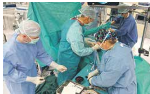
I ARTROSKOPICKÉ ORTOPEDECKÉ operační výkony vyžadují souhru celého týmu.

Ortopedicko-úrazové oddělení Oblastní nemocnice Kladno poskytuje komplexní péči – od ošetření