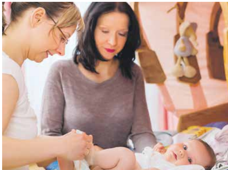
PORODNÍ ASISTENTKY z kladenské porodnice přinášejí maminkám i miminkům klid, podporu a odbornou péči přímo do jejich domova.

„S domácími návštěvami jsme začaly již loni v říjnu, kdy ještě nebyly vždy hrazeny zdravotními pojišťovnami.