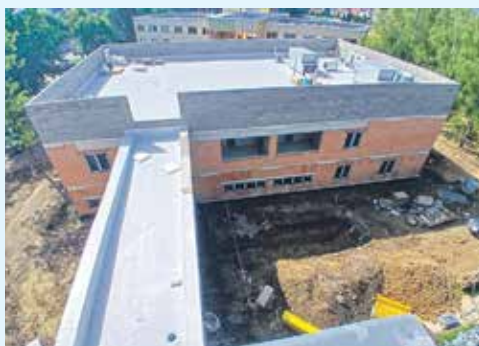
STAVBA NOVÉ NEMOCNIČNÍ KUCHYNĚ a jídelny vstupuje do další etapy.

„V současné době se soustředíme především na realizaci technických instalací uvnitř objektu a provedení napojení objektu na stávající trafostanici. Probíhají práce na rozvodech elektřiny, vzduchotechniky, vody a kanalizace, které jsou