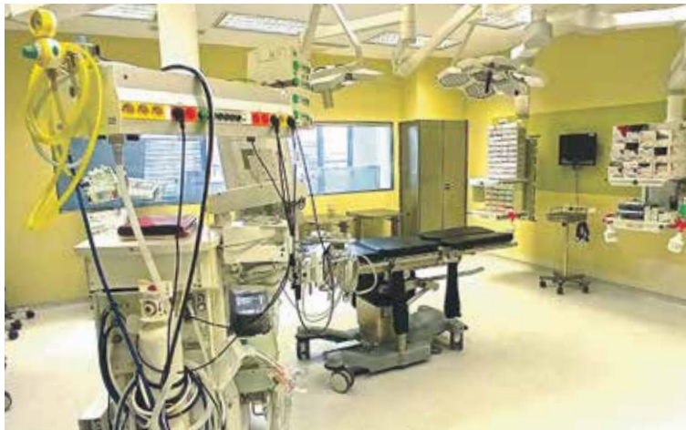
OPERAČNÍ SÁLY jsou vybaveny špičkovou technikou pro široké spektrum chirurgických oborů.

Za dveřmi operačních sálů se tak každý den odehrávají desítky výkonů, které pacientům pomáhají vracet zdraví i kvalitu života. Jde o jedno z nejdůležitějších pracovišť nemocnice, kde moderní technologie a zkušenosti zdravotníků společně přispívají k úspěšné léčbě tisíců pacientů ročně.