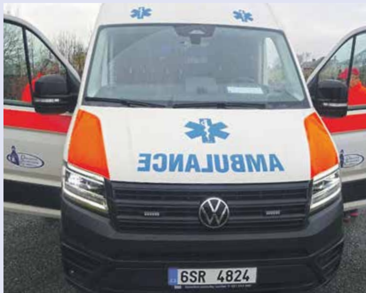
SANITNÍ VOZY Dopravní zdravotní služby ON Kladno každoročně přepraví desítky tisíc pacientů.

Všechna vozidla splňují přísné požadavky pro zdravotnickou dopravu a jsou zařazena do systému integrovaného záchranného systému. Nepřetržitý provoz dispečinku a úzká spolupráce se Zdravotnickou záchrannou službou Středočeského kraje umožňují pružně reagovat na potřeby pacientů i zdravotnických pracovišť. Jen za loňský rok najela vozidla dopravní zdravotní služby více než 808 tisíc kilometrů, což odpovídá více než dvacetinásobku obvodu Země.