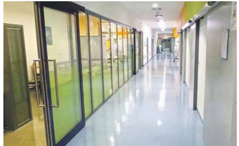
CENTRÁLNÍ OPERAČNÍ SÁLY ON Kladno poskytují zázemí pro plánované i akutní operační výkony.