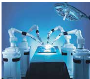
ROBOTICKÝ OPERAČNÍ systém Versius umožňuje provádět šetrné miniinvazivní operace.

„Robotický systém se nám podařilo velmi rychle zavést do běžné praxe. Díky jeho flexibilitě a intuitivnímu ovládní postupně rozšiřujeme spektrum výkonů i počet